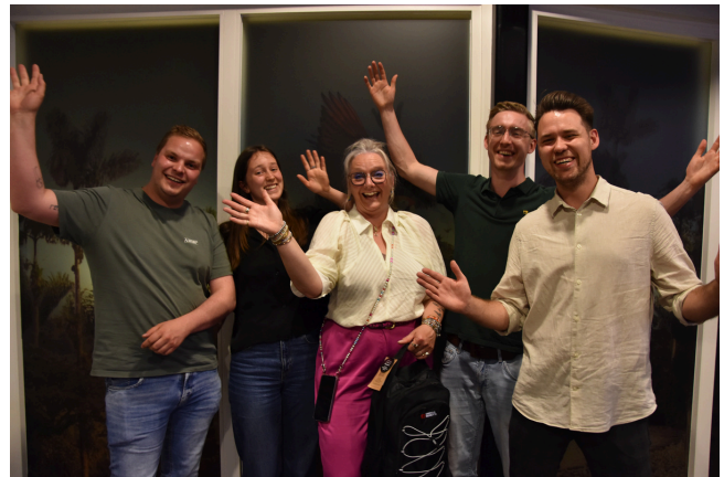
links: stichting Move; midden: Tas voor de toekomst; rechts: Onderwijsbegeleiding Twente

Op de deelnemersavond presenteren de uitgenodigde projecten zich: stichting Move, stichting Onderwijsbegeleiding Twente en stichting Tas voor de toekomst. Ze vertellen welk bedrag ze hebben aangevraagd en wat ze ermee kunnen doen. Op de volgende pagina vindt u een infographic (puntsgewijze weergave) van deze projecten. Tijdens de avond was deze op alle tafels te vinden voor de deelnemers.